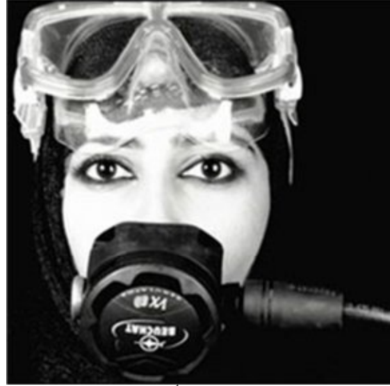
شكل (٢) منال الضويان ، أنا غواصة، ٢٠٠٧م

وفي نفس العام ٢٠١٣ محقق عمل الضويان (معلقات سوياً) شكل (٣) رقماً قياساً في مزاد (سوثبيز - Sotheby's) في الدوحة، حيث بيع بمبلغ (٣٢٩.٠٠٠) دولار أمريكي، هذا العمل عُرض في عام ٢٠١١م للمرة الأولى في دبي ضمن معرض مجموعة الحافة العربية بعنوان (محطة-Terminal) ثم في بينالي البندقية (٥٤) في نفس العام ضمن معرض (مستقبل وعد- The Future of a Promise) حتى حطت به الرحال للبيع في مزاد (سوثبيز)، ويعد هذا العمل الأكثر تأثيراً من بين مشاريع الضويان؛ يتكون من مجموعة كبيرة من الحمام الخزفية في هينات متعددة ترفرف في الهواء، طُبع عليها صور لتصاريح سفر حقيقية لنساء سعوديات تحتاجها المرأة في السعودية من ولي أمرها للسفر خارجاً، وصرحت الفنانة في أكثر من لقاء بأنها تجد صعوبة في نقل هذه الكمية من القطع لعرضها في الداخل بصفتها عملاً فنياً وليس بغرض التجارة، حيث لا توجد جهة محددة لإعطاء تصريحات خاصة للفنانين بالمملكة، كما أن واجه هذه العمل ردود بعض المتلقين السلبية باعتبار العمل يدعو المرأة إلى التمرد على قوامة الرجل التي أقرها الدين.