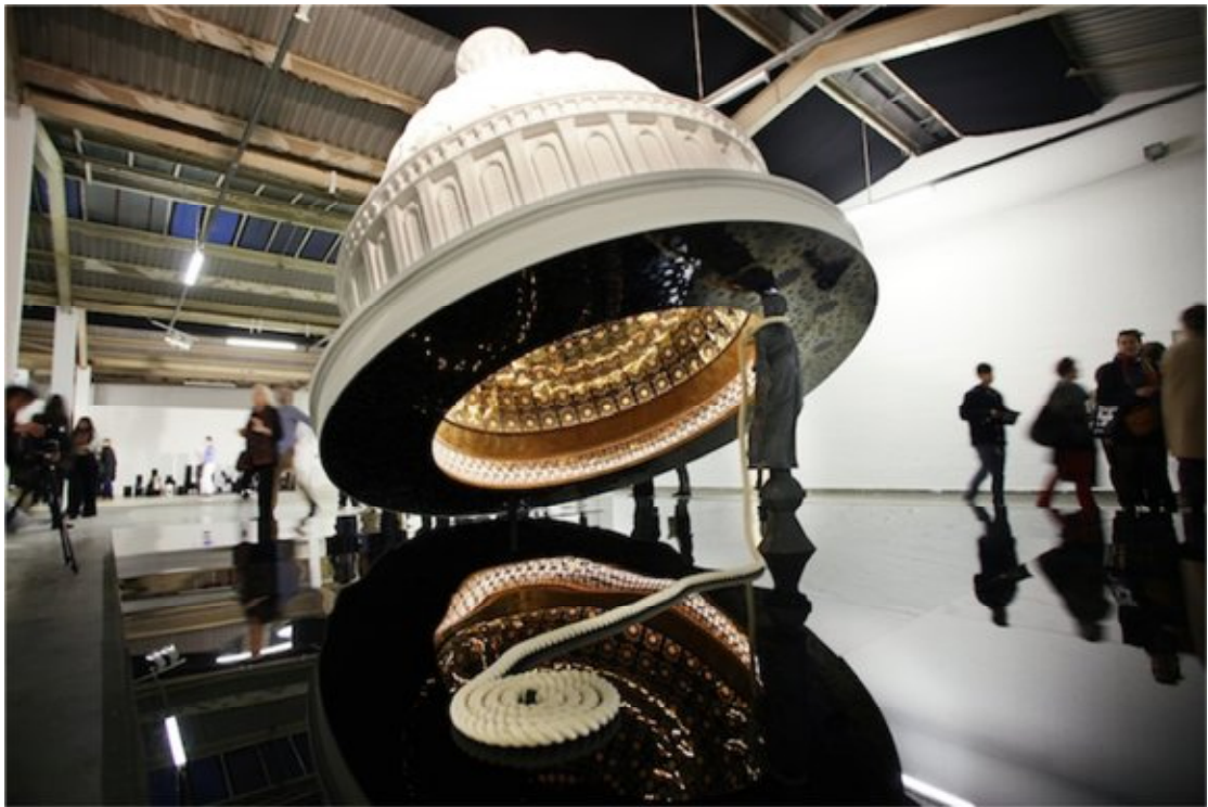
شكل (٩) عبدالناصر غارم، قبة الكونجرس، ٢٠١٢م http://edgeofarabia.com