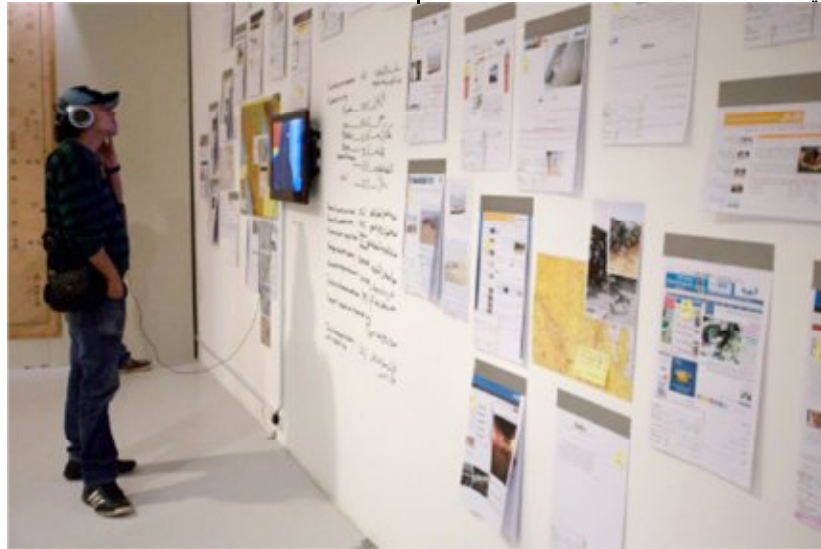
شكل (٥) منال الضويان، الصدمة، ٢٠١٤م

وفي مارس ٢٠١٤م في المتحف العربي للفن الحديث بالدوحة، نفذت الضويان مشروع (الصدمة-Crash) شكل (٥) المعبر عن حوادث السيارات المتكررة والتي أنهت حياة عدد من معلمات المدارس في المملكة، عرضتها من خلال تراكم الأشكال المتعددة للبيانات التي تمّ جمعها عن الحوادث والوثائق القديمة معلقة أو مكتوبة على الحيطان، وما نشرته بعض الناجيات عبر مواقع التواصل الاجتماعي قبل الحوادث أو بعدها، ومن هذا المشروع فُتح النقاش مع الطلاب القطريين والأساتذة والصحفيين، ليأخذ هذا النوع من التفاعل مكانه كجزء من عملية البحث التي تسعى إليها الفنانة، لقد أشركت المتلقي فعلياً في تسجيلات صوتية يتاح سماعها عبر سماعات في داخل المعرض. (الفاصي، ٢٠١٣)