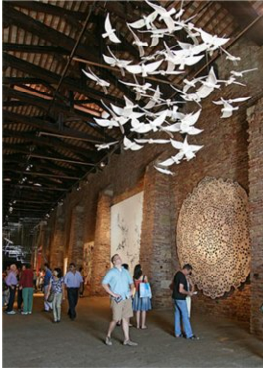
شكل (٣) منال الضويان، معلقات سوياً، ٢٠١١م