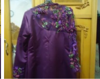
شكل (١) الخلف