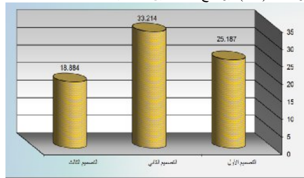
والشكل ( ١٠ ) يوضح الدلالة بين التصميمات الثلاث المنفذة.

شكل ( ١٠ ) يوضح الدلالة بين التصميمات الثلاث المنفذة لملابس السهرة باستخدام التطريز بشرائط الساتان مع التطريز اليدوي وبين مدى رقى جماليات ملابس السهرة للسيدات وفقا لأراء المتخصصين