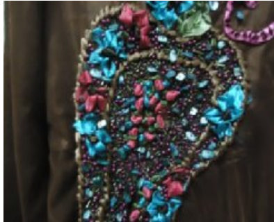
شكل (٩) شكل التطريز شرائط الساتان