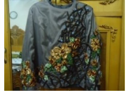
شكل (٤) الأمام