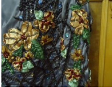
شكل (٥) الكم