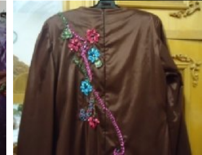
شكل (٧) من الخلف

جدول (١) قيم معاملات الارتباط بين الدرجة الكلية لكل محور والدرجة الكلية للاستبيان