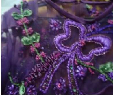
شكل (٣) التطريز بشرائط الساتان

من الساتان البني، وعليه طبقة من التل ولونه بني أيضا، وتم التطريز على التل بشرائط الساتان ذات اللون البني مع درجات اللون، ودمجت الباحثة مع شرائط الساتان التطريز اليدوي بالغرز الفوشيا، التركواز، مع البني، والكم الأيسر مختلف عن الكم الأيمن في كونه واسع وبأسورة في نهاية الكم. تم إعداد وتطبيق أستمارة تحكيم لعرض الثلاث موديلات المنفذة (- فستان سواريه لونه موف - بلوزة رصاصي مع جيبية منقوشة بالرصاصي، فستان سوريه لونه بني) على المتخصصين في مجال النموذج التصميمي الأول