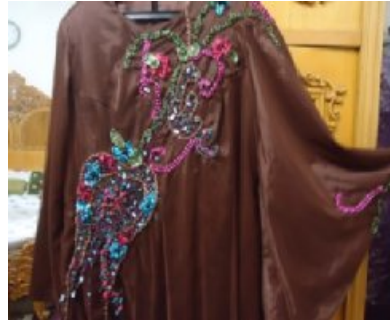
شكل (٨) من الأمام