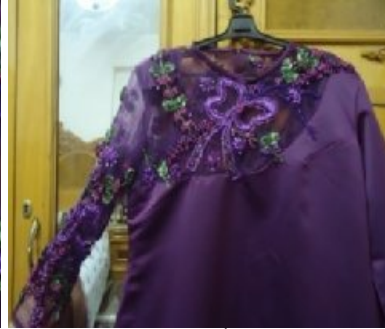
شكل (٢) الأمام