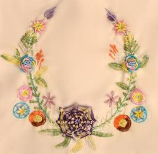
صورة(34) وسادة من قماش الدامسك البيج بالخياط الحريرية