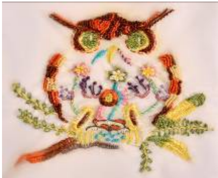
صورة (30) تيشرت من قماش القطنى أبيض بالخياطة الحريرية