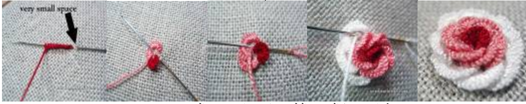
صورة (6،7،8،9،10) خطوات تنفيذ الوردة البلدي باستخدام غرزة العروة (Helen Staven:2003-212)

لونين أو أكثر من الخيوط لتعطي شكلا جذابا للوردة ،وتوض الصور من (10:6) خطوات تنفيذ الوردة البلدي Helen ( Staven:2003)