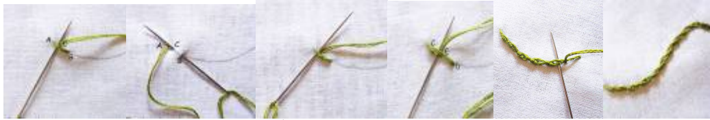
توضح خطوات تنفيذ غرزة الفرع

توضح خطوات تنفيذ غرزة بيكو المنسوجة 7- غرزة الفرع البرازيلي: Stem Stitch من أهم غرز التطريز البرازيلي المستخدمة في عمل فروع الأزهار والأشجار وفي تحديد الأشكال طريقة عملها: 1- يتم تنفيذ هذه الغرزة من اليسار إلى اليمين. 2- نغرز الإبرة عند النقطة (A) ثم ندخلها عند النقطة (B) ونخرجها عند النقطة (c). 3- بعد ذلك أدخل الإبرة أسفل الغرزة (A-b) في المنتصف عند