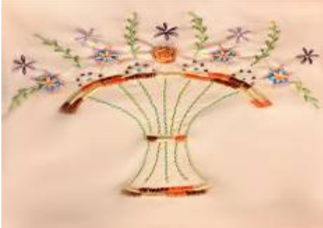
صورة (28) وسادة من قماش الدامسك البيج بالخياطة الحريرية