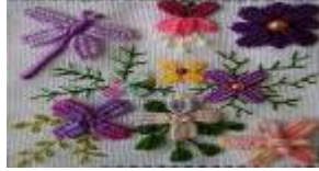
صورة (11) توضح زهور منفذة بغرزة العروة المزدوجة