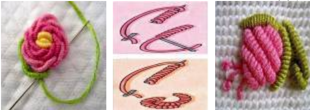
صورة (4) توضح غرز الروكو على شكل زهرة