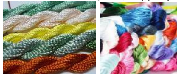
صوره (1) توضح الأنواع المختلفة من الخيوط الحرير

تعتبر خيوط التطريز من الخامات الأساسية المؤثرة على جودة التطريز لما لها من تأثير واضح وفعال على قوة تحمل وجمال النسيج " القطع المطرزة " بعد تطريزه . (ابراهيم مرزوق: 2009) ويختلف التطريز البرازيلي عن التطريز العادي في استخدام الخيوط الحريرية شديدة اللمعان .