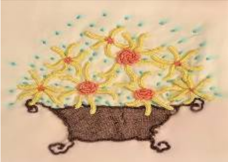
صورة (29) وسادة من قماش الدامسك البيج بالخياطة الحريرية