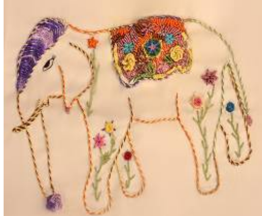
صورة(31) وسادة من قماش الدامسك البيج بالخياط الحريرية