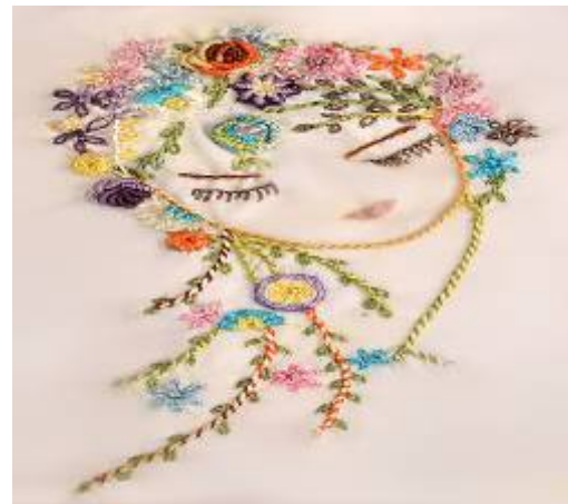
صورة(29) تيشرت من القماش القطن الأبيض بالخياط الحريرية

الفرض الأول: ينص الفرض على أنه: "توجد فروق دالة إحصائياً بين متوسطي درجات الطلاب في الاختبار المعرفي قبل وبعد تطبيق الوحدة لصالح التطبيق البعدي". وللتحقق من صحة هذا الفرض تم تطبيق اختبار "T. Test" لدلالة الفروق بين متوسطي درجات الطلاب في الاختبار المعرفي قبل وبعد الوحدة، والجدول التالي يوضح ذلك: