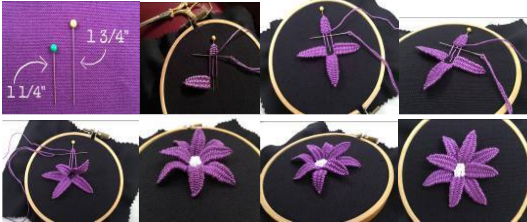
الصورة من (15، 16، 17، 18، 19، 20، 21)

النقطة (c) وذلك بدون إختراق النسيج، ويتم عمل عقدة مرتين عند النقطة (c) حول الخيط. 4- ويتم عمل غرزة من عند النقطة (c) ندخل الإبرة بعد إختراق النسيج عند النقطة (D) ونخرجها عند النقطة (E). 5- يتم عمل عقدتين عند النقطة (E) كالسابق، ويتم تكرار نفس الخطوات حتى الإنتهاء من العمل، وتوضح خطوات التنفيذ الصور من (22، 23، 24، 25، 26، 27). (Fretias, Maria-2000)