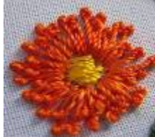
صورة (11) طريقة عمل عقدة الفرنسية ذات ساق (ابراهيم مرزوق:2009)

طريقة تنفيذ العروة المنسوجة تنفيذ السطر الاول من زهرة منفذة غرزة العروة المنسوجة غرزة العروة المنسوجة والمنسوجة والثاني