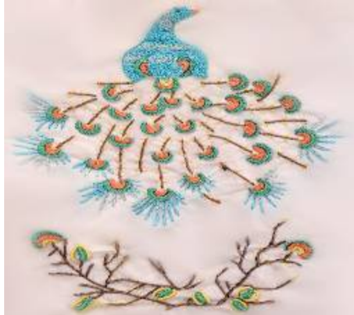
صورة(30) تيشرت من القماش القطن الأبيض بالخياط الحريرية