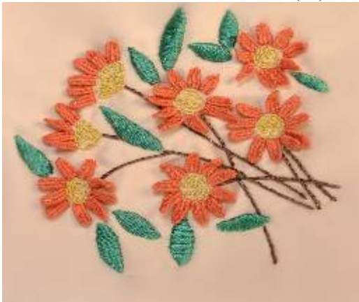
صورة (31) وسادة من قماش الدامسك البيج بالخياطة الحريرية

لقياسه، وقد أقرروا بصلاحيته للتطبيق . ، وقد أبدى بعض المحكمين بعض الملاحظات فيما يخص تعديل الصياغة اللغوية لبعض الأسئلة، وقد تم الأخذ بأرائهم وبذلك أصبح الاختبار في صورته النهائية صالح للتطبيق