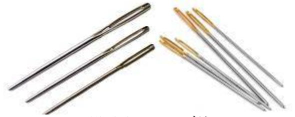
شكل (1) يوضح انواع الإبر

ولعمل الوردة البلدي يتبع نفس خطوات العمل السابقة: