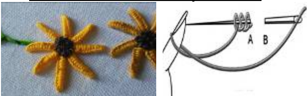
صورة رقم (5) توضح غرز العروة على شكل خطوط