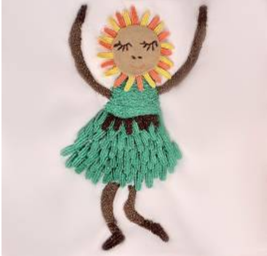
صورة(33) تيشرت من قماش القطن الأبيض بالخياط الحريرية