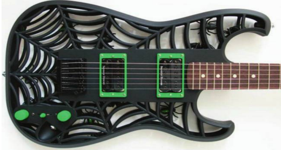
شكل رقم (3) آلة موسيقية على شكل شبكة عنكبوت مجسمة (p89,17)

من خلال تكنولوجيا التصنيع بالإضافة التي أصبحت توفر إمكانية تجسيد عقد التصميم وابعاد الخيالات التي من الممكن ان تتحقق بطريقة دقيقة ومبسطة (p88,17). وبذلك تسمح تكنولوجيا التصنيع بالإضافة بإعادة النظر في الأساسيات والمحددات مما يسهم في إعادة تكوين وخلق منتجات جديدة ومطورة متحررة من قيود التصنيع التقليدية (p4,5). فبدلاً من الطلب من المصممين بتطوير أفكار موضوعة سابقاً، أصبحت الشركات تطلب منهم الآن بخلق أفكار مبتكرة تلبى احتياجات المستهلكين ورغباتهم ليس من أجل خلق منتجات فقط وإنما بخلق خبرات جديدة أيضاً. إذ يعتبر الدور السابق هو دور تكتيكي يؤدي إلى خلق قيم محدودة، بينما الأخير هو استراتيجي يؤدي إلى قيم جديدة. في هذا الإطار فإن تفاعل المصممين مع تكنولوجيا التصنيع بالإضافة لا يقتصر على تكوين النماذج الأولية فقط كما كان سابقاً، ولكن باعتبارها تكنولوجيا تصنيع إبداعية وملهمة والتي تتطلب طريقة مختلفة للتفكير في قضايا التصميم (p61,19). ومن أجل لمس هذا الجانب بتطبيقه المادي نلاحظ المثال الاتي الذي يمثل آلة موسيقية قام المصمم من خلالها بتصميم تكوين مبتكر من خلال الاستعارة الشكلية لشبكة العنكبوت وتوظيفه بطريقة ثلاثية التكوين العام للاله دون التقيد بمحددات التصنيع التقليدية أو تكوين قوالب خاصة.