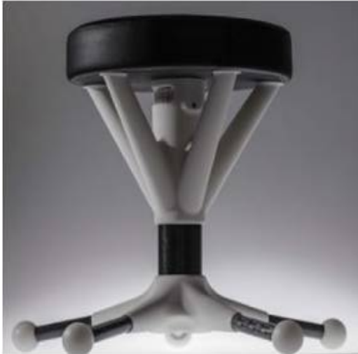
شكل (5) مقعد خفيف الوزن هجين بالاعتماد على تكنولوجيا التصنيع التقليدية وتكنولوجيا التصنيع بالإضافة (p98,3)

كما ويمكن بناء هياكل خفيفة الوزن بواسطة تكنولوجيا التصنيع بالإضافة بطريقة كاملة او حتى عن طريق الجمع بينها وبين طرق التصنيع التقليدية لخلق ما يسمى بالمنتجات الهجينة hybrid products من أجل استخدام مزايا كل تكنولوجيا لتحقيق اداء افضل. اذ وكما نلاحظ في الشكل التالي تم الجمع بين طباعة أجزاء من القاعدة وجميع القطع الموصلة مع طرق التنجيد التقليدية من أجل تقليل نسبة الوزن وتحسين الأداء من خلال احتساب الحد الادني من المواد لتحتمل أقصى وزن للجلوس في تصميم مقعد جلوس (p98,3).