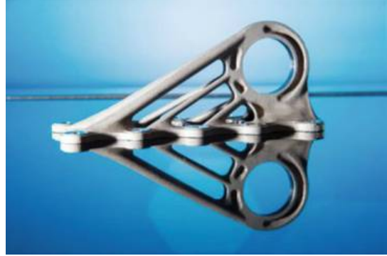
شكل (4) مسند المقصورة لطائرة ايرباص Airbus A350 XWB مصنوع بطريقة الطباعة الثلاثية (p43,12)

(p495,4). اذ اصبح للتصنيع بالإضافة دور مهم في قطاع الطيران وقطاع النقل ، من خلال تأثيرها المزدوج على وزن الأجزاء التي يتم نقلها من جهة وانخفاض وزن المركبات والطائرات من جهة أخرى اذ تسهم في خفض نسبة وزن الأجزاء المطبوعة من 40-60% مما يجعل الطائرات تستهلك وقود اقل بكثير. ولذلك تم استخدام الأجزاء المطبوعة بالفعل في طائرات الابرصاص التجارية في الموديلات A350 و A320 ومجموعة A300/A310 (p42,2)