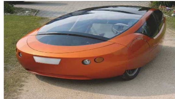
شكل رقم (2) سيارة ستراتي Strati المنتجة بالطباعة الثلاثية (p280,5)

ارتباطاً وثيقاً مع التنمية المستدامة والنمو الأخضر (p7,8). إمكانية تلبية الاحتياجات المختلفة لكل فرد من العملاء الأمر الذي يؤدي إلى تحسين الرفاهية العامة بين الأفراد (p3,20). فمع تطور توجهات التصميم الحديثة لم يعد دور المصممين يقتصر على تصميم المنتجات المادية، وإنما بناء أنواع جديدة من العمليات، الخدمات، التفاعل مع المنتجات، وسائل الترفيه وطرق التواصل وجميع أنواع الأنشطة التي تركز على الإنسان. وبفضل الابتكارات التكنولوجية وإمكانات التصنيع بالإضافة فقد أصبح يمكن للمستهلك ان يشارك في انشاء المنتج النهائي (p60,19). إذ توفر تكنولوجيا التصنيع بالإضافة فرص متواصلة لتطوير المنتجات وتغيير أجزاء معينة فيها وفقاً لمتطلبات العملاء واحتياجاتهم دون الحاجة لعمل قوالب جديدة ودون تكاليف إضافية (p241,18). احد تطبيقات هذا الجانب المهمة كانت في عام 2014 عندما عرضت تكنولوجيا التصنيع الدولية في شيكاغو اول سيارة مطبوعة بطريقة التصنيع بالإضافة باسم ستراتي Strati، والتي طبعت كقطعة واحدة. إذ تم تشكيل جميع هيكل وبدن السيارة باستثناء المكونات الميكانيكية مثل المحرك ونظام التعليق والبطارية والاجزاء الأخرى التي يجب تجميعها بشكل منفصل. وتأمّل الشركة المصنعة ( لوكل موتورز Local Motors ) في إنتاج السيارة باستخدام تقنية الطباعة الثلاثية بنسبة 90%. و استخدام ميزات جمالية مختلفة عالية التخصيص وفقاً لمتطلبات كل فرد على حدة (pp278-279,5). ويعتبر هذا الجانب إنجازاً مهماً في جانب تطوير المنتجات نحو اهتمامات المستخدمين ومتطلباتهم الشخصية والخروج عن أهم محددات الإنتاج الكمي في إطار المنتج الواحد وبالأخص في مجال تصاميم السيارات التي لا تتغير تصاميمها لثلاث سنوات أو أكثر بسبب محددات الإنتاج الكمي وكلفه العالية.