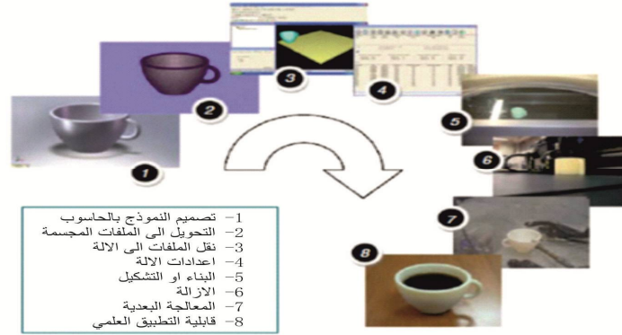
شكل رقم (1) مراحل التصنيع بالإضافة (7،7) (p7)

الأجزاء لاستخدامها في عمليات متعددة المراحل كالصب. كما وانها تكون ممتازة في تشكيل المنتجات النهائية وخصوصا في مواد الفولاذ وسبائك المعادن الأخرى لإنتاج أجزاء عالية الدقة وجيدة الانهاء. بينما على العكس تحتوي بعض أجزاء تقنية التصنيع بالإضافة على فراغات او تباين في سطوحها.